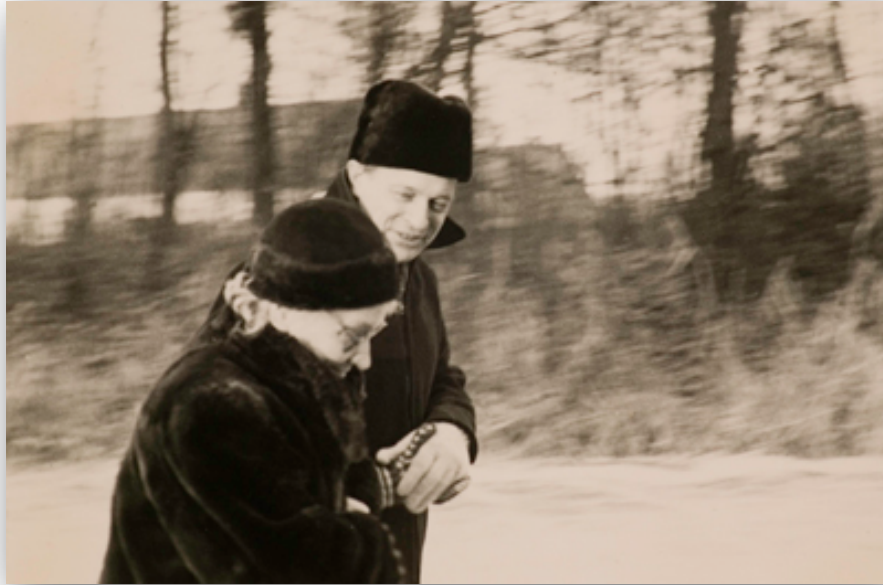
Marie Gevers et Paul Willems patinant (document issu des archives de la famille Traey)

Passionnée de lecture dès son plus jeune âge, elle fut particulièrement conquise par le recueil de poésie de Maurice Maeterlinck : Serres chaudes . Nous percevons dans ce choix son attrait pour les mystères et les rêves que peuvent suggérer les manifestations de la nature , ainsi que la recherche d'une écriture épurée, en quête de vérité .