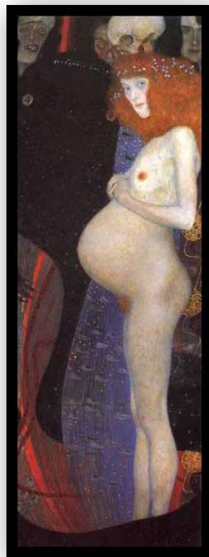
Gustav Klimt, Espoir I , 1903 — Le monde des arts 3