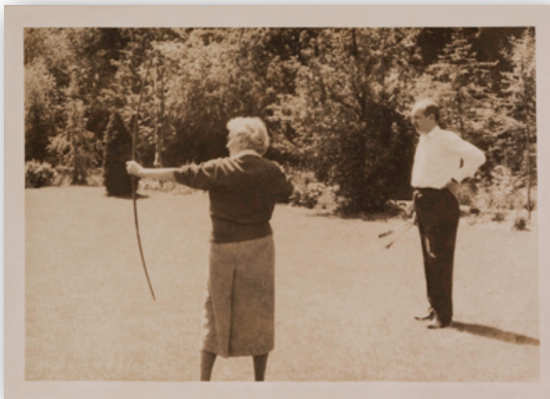
Marie Gevers et Paul Willems à Missembourg (document issu des archives de la famille Traey)