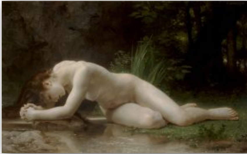
William-Adolphe Bouguereau, Biblis , 1884 — Wikimédia 2