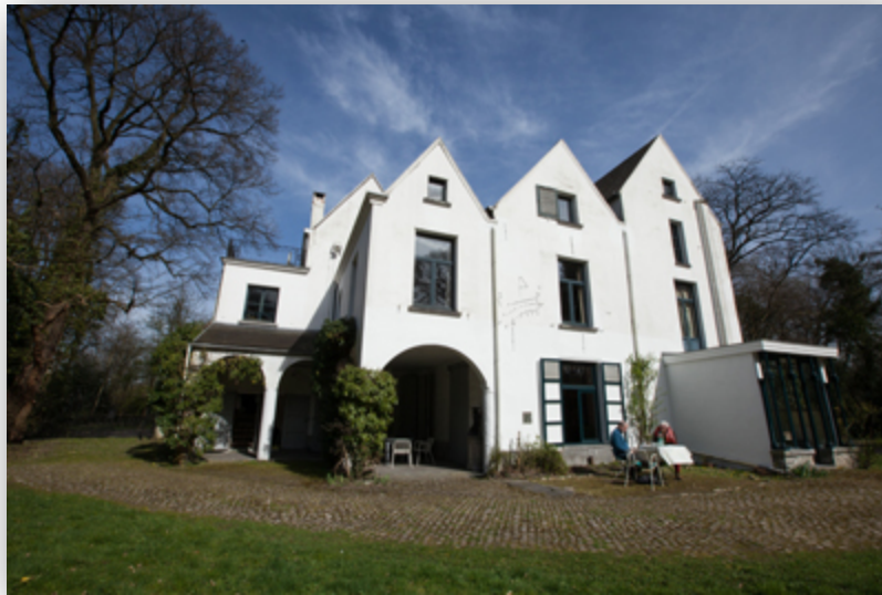
Maison de Missembourg