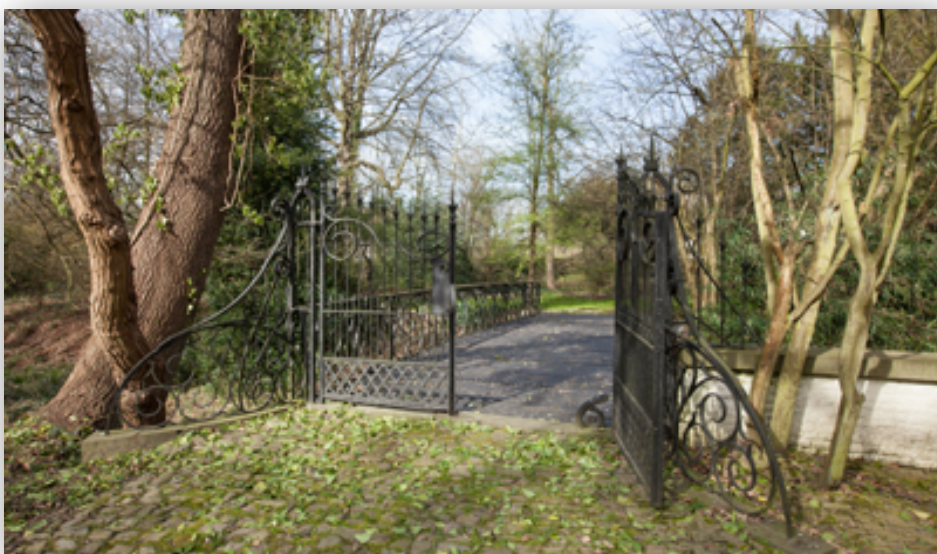
Portail dans le jardin de Missembourg

Marie Gevers est une auteure belge d'expression française née à Edegem, près d'Anvers, le 30 décembre 1883. Elle est née dans la campagne anversoise et a grandi, avec ses cinq frères aînés, dans le château de Mussenborg, qu'elle rebaptisait Missembourg.