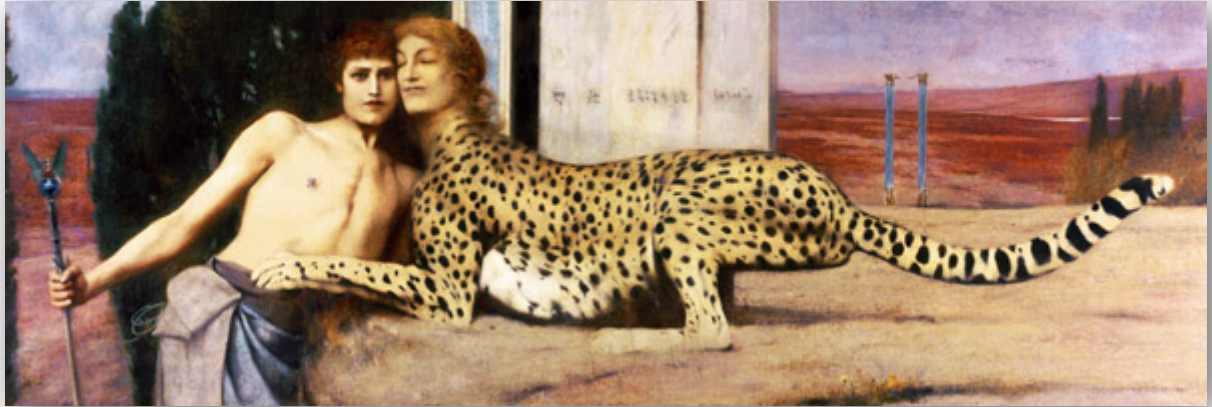
Fernand Khnopff, Des caresses, ou l'Art, ou le Sphinx , 1896 4