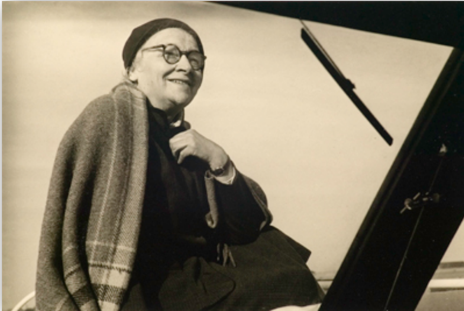
Marie Gevers (document issu des archives de la famille Traey)

Marie Gevers est une auteure belge d'expression française née à Edegem, près d'Anvers, le 30 décembre 1883. Elle est née dans la campagne anversoise et a grandi, avec ses cinq frères aînés, dans le château de Mussenborg, qu'elle rebaptisait Missembourg.